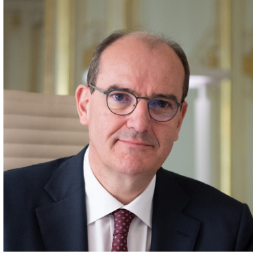
Jean Castex, Premier ministre

Déclaration de politique générale Assemblée nationale, 15 juillet 2020